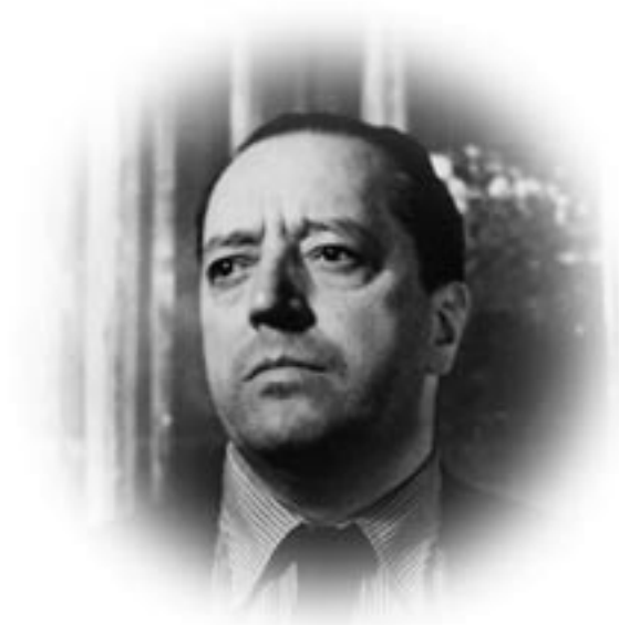
Ludwig Mies van der Rohe 1886-1969